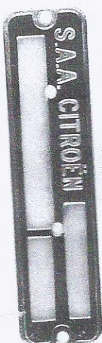
Fig. 41 - Plaque moteur